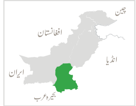
مرتب شدہ بذریعہ پی پی اے ایف۔ جی آئی ایس لیبارٹری