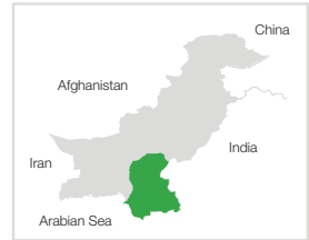
Processed & Prepared by: PPAF GIS Laboratory